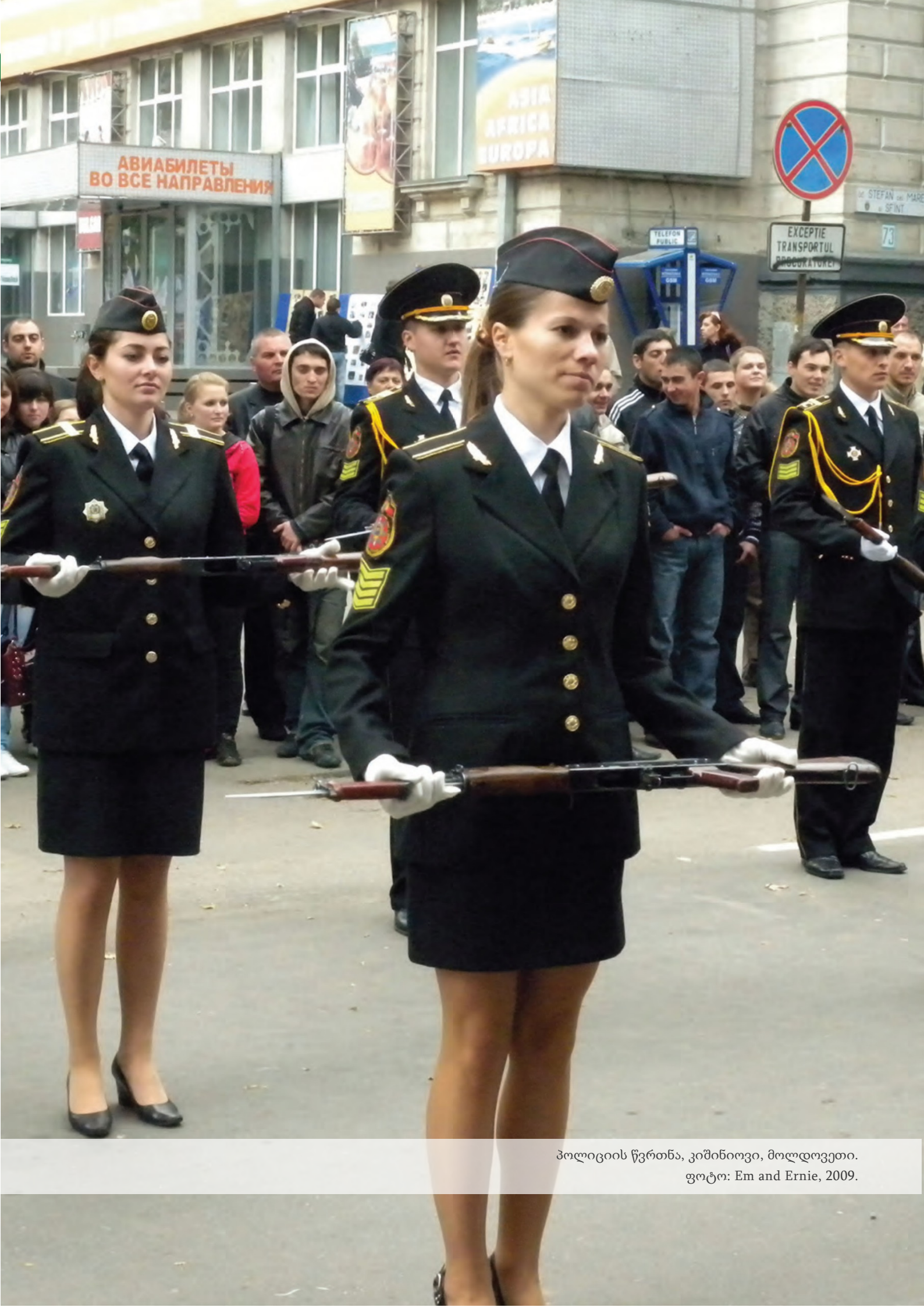
პოლიციის წვრთნა, კომინიოვი, მოლდოვეთი. ფოტო: Em and Ernie, 2009.