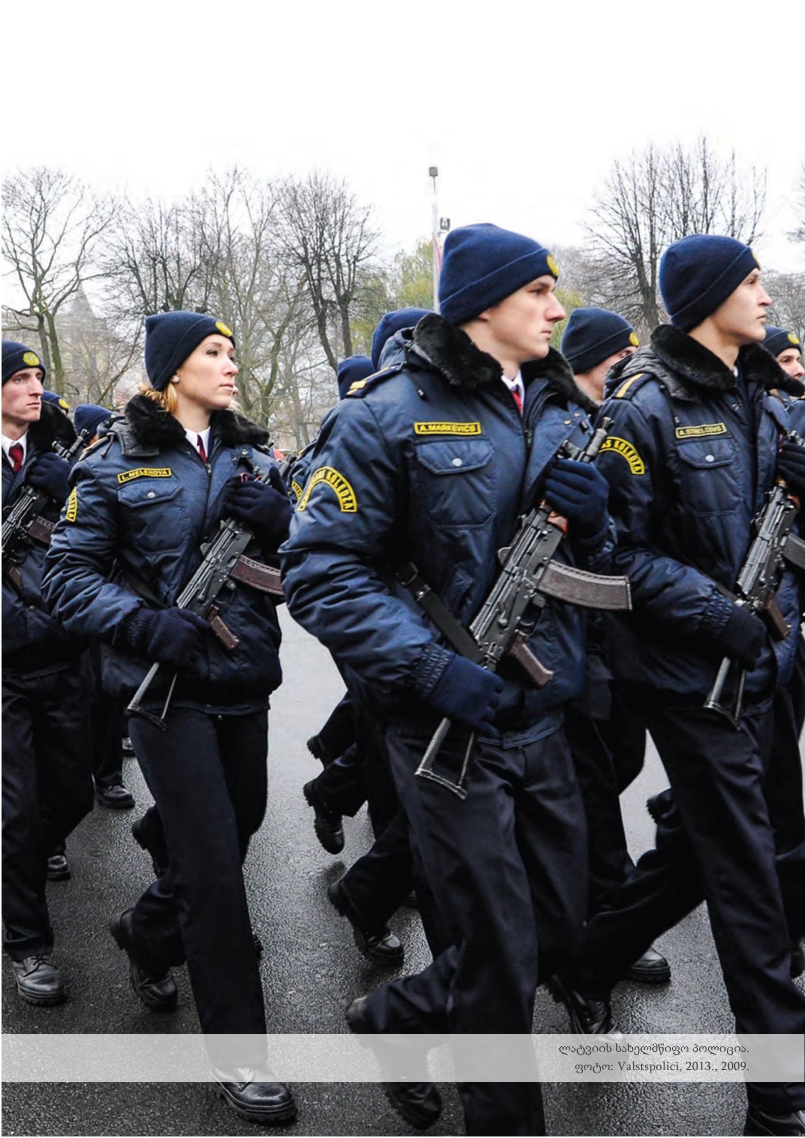
ლატვიის სახელმწიფო პოლიცია. ფოტო: Valstspolici, 2013., 2009.