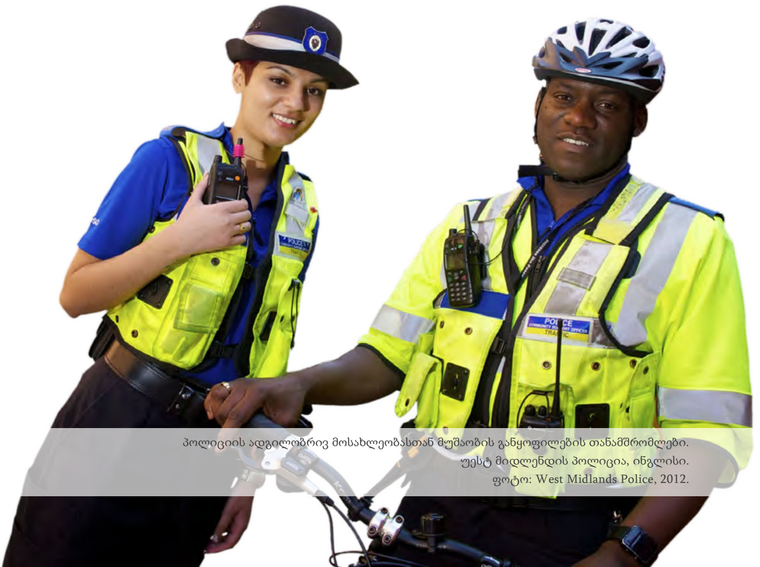
პოლიციის ადგილობრივ მოსახლეობასთან მუშაობის განყოფილების თანამშრომლები. უესტ მიდლენდის პოლიცია, ინგლისი.